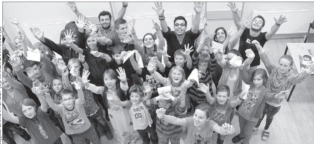
W polskich szkołach wiele się dzieje. Podstawówka w Jablonkowie gościła niedawno zagranicznych studentów.