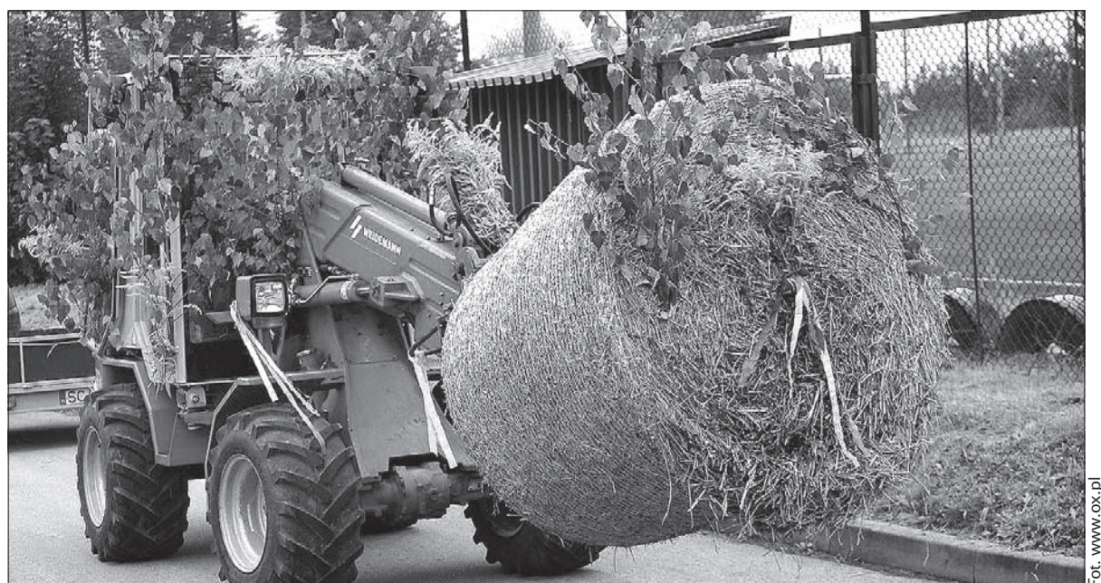
Kaczyce: Bez prezentacji sprzętu rolniczego nie mogą się obejść żadne dożynki.