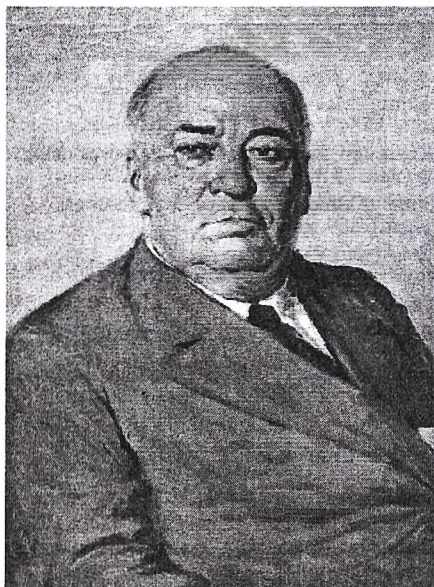
Профессор Ромуальд Войцик (1952 г.)