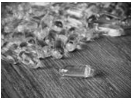
Witaminę D trzeba suplementować, trudno uzyskać jej odpowiednią ilość z pożywienia

Oprócz zmniejszenia ryzyka wcześniej wymienionych schorzeń, dzięki regularnemu dbaniu o odpowiednią podaż witaminy D możemy zyskać szereg korzyści zdrowotnych. Badania wskazują, że ryzyko jakiegokolwiek raka inwazyjnego (wyłączając raka skóry) u kobiet ze stężeniem 25(OH) D w surowicy >40ng/ml było aż o 67% niższe niż u kobiet z niedoborem witaminy D.