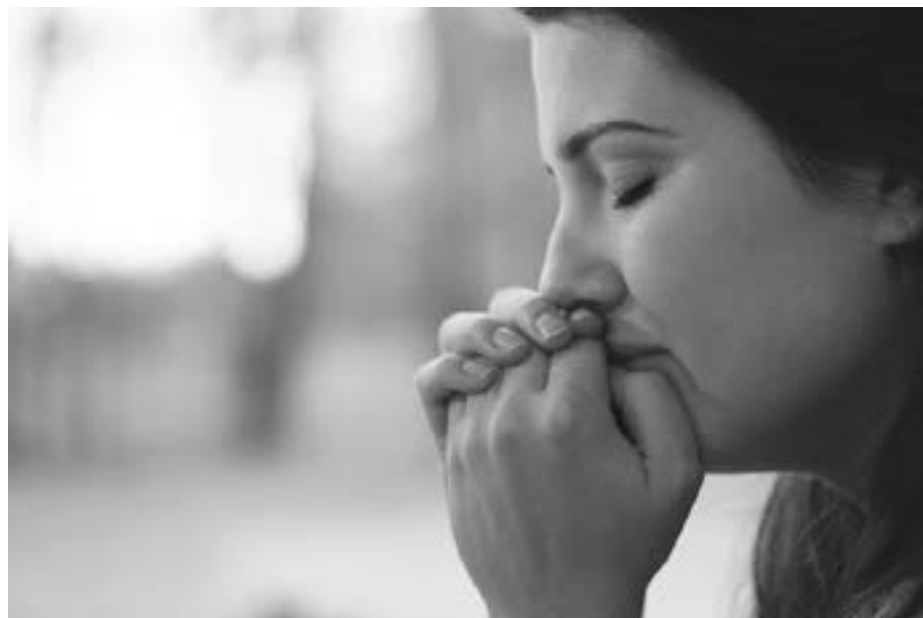
Depresja może być skutkiem niedoborów witaminy

możliwość w tym czasie przebywać na słońcu nawet 15 minut z odsłoniętymi nogami i przedramionami