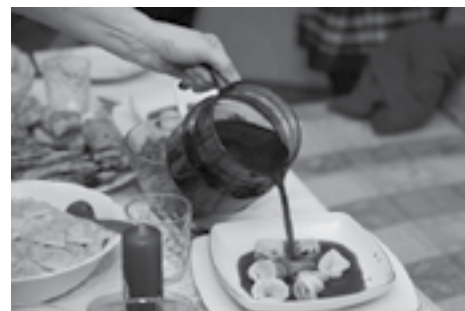
Wigilijny barszcz czerwony

Kluczem do sukcesu jest odpowiednie przechowywanie. Jak się za to zabrać? Masz do wyboru dwie opcje. Możesz zamrozić je w pojemnikach. Pamiętaj przy tym, żeby nie używać tych zrobionych ze szkła, mogą bowiem pęknąć pod wpływem niskiej temperatury. Możesz zamknąć zupę w słoikach i zapasteryzować je na sucho (w piekarniku) lub mokro (w garnku z gorącą wodą). Przed wigilią wystarczy tylko otworzyć słoik lub wyjąć pojemnik z zamrażarki, podgrzać i podawać z odpowiednimi dodatkami.