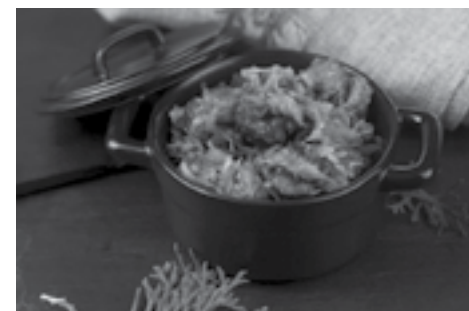
Bigos to tradycyjne danie, którego nie może zabraknąć w pierwszy dzień świąt

Kilka tygodni przed świętami można także przygotować kutię. Ta słodka mieszanka zrobiona z pszenicy, maku, bakalii oraz miodu doskonale nadaje się do mrożenia. W wigilijny wieczór wystarczy ją odgrzać w piekarniku i postawić na stole.