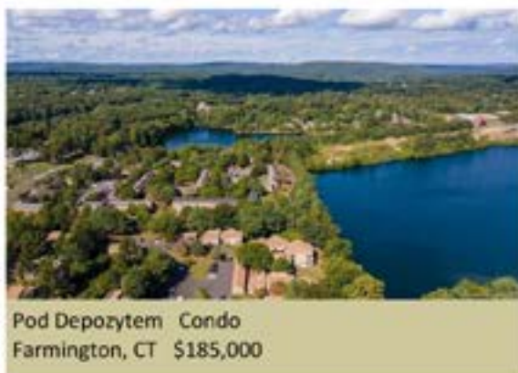
Pod Depozytem Condo Farmington, CT $185,000