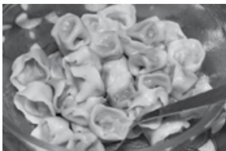
Wiele potraw na kolację wigilijną możemy przygotować wcześniej

Siekane grzyby i kapusty do farszu, wyrabianie ciasta, w końcu sklejenie pierogów, uszek i kołdunów to zajęcie na naprawdę długie godziny. Zamiast przygotowywać je w wigilijny poranek, możesz zrobić to już kilka tygodni wcześniej. Doświadczone gospodynie podkreślają, że ważne jest odpowiednie przechowywanie. Można bowiem zamrozić je na surowo - na tacce obsypanej mąką układamy pierogi, tak aby się nie stykały i mrozimy. Dopiero mocno schłodzone można włożyć do woreczka - wtedy się nie skleją. Wolisz obgotowane? Pamiętaj, żeby przed zamrożeniem pozwolić im się dobrze wysuszyć. Dzięki temu unikniesz utworzenia się jednolitej pierogowej masy.