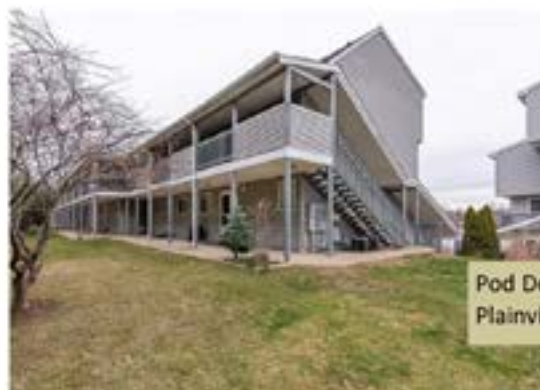
Pod Depozytem Condo Plainville, CT $122,500

Służę pomocą w kupnie i sprzedaży nieruchomości