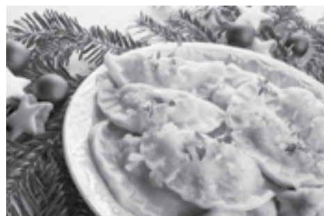
Przed mrożeniem surowych pierogów pamiętaj o posypaniu ich mąką

Dwanaście tradycyjnych potraw wymaga ogromnego nakładu pracy. A przecież trzeba przygotować jeszcze ciasta i pierniczki do dekorowania choinki. Aby uniknąć niepotrzebnego stresu, warto przygotować część dań dużo wcześniej. Gwarantujemy, że dzięki tym prostym wskazówkom ty nie nadwyreżysz sił, a goście wigilijni wyjdą z kolacji oczarowani!