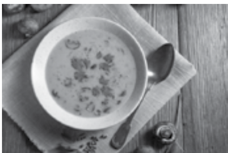
Do zupy grzybowej warto dodać garść leśnych grzybów

Zamiast uszek czy kołdunów do barszczu podajesz paszteciki w cieście drożdżowym lub francuskim? Je także możesz przygotować wcześniej. Upieczone i wystudzone ciasto pokrój na mniejsze porcje i włóż do zamrażarki. W wigilię wystarczy je włożyć do piekarnika i odgrzać.