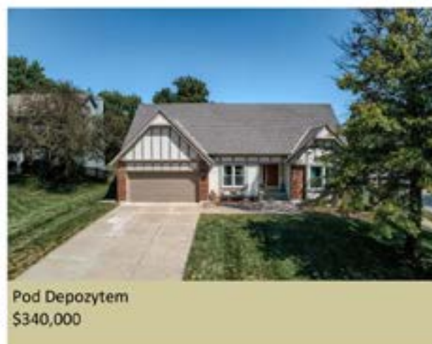
Pod Depozytem $340,000