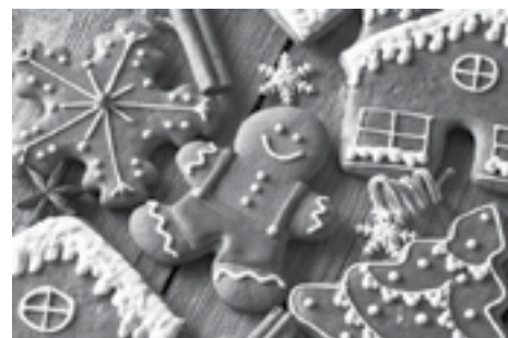
Świąteczne pierniczki można ozdobić i udekorować nimi choinkę

Barszcz przecedzić przez sitko. Doprawić go majerankiem, solą, octem, pieprzem i cukrem.