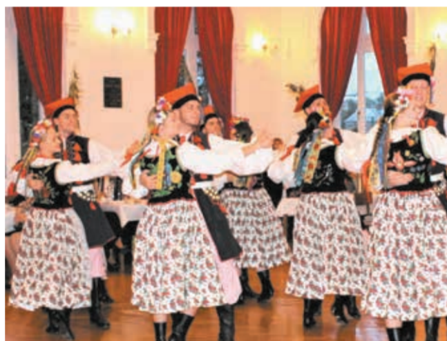
• Dąbrowa. Wiązanka tańców krakowskich w wykonaniu „Suszan”.