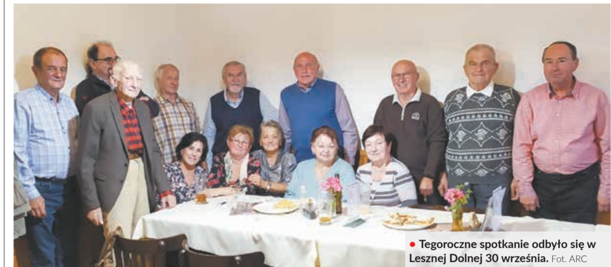
• Tegoroczne spotkanie odbyło się w Lesznej Dolnej 30 września.