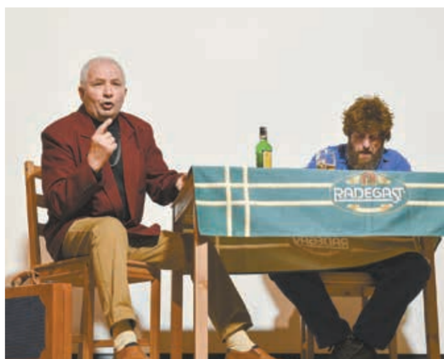
• Nawsie. Skecz o obietnicach przedwyborczych bez pokrycia.