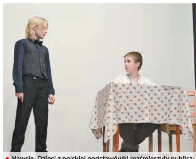
• Nawsie. Dzieci z polskiej podstawówki rozmieszyły publiczność scenką o działacza i jego żonie.