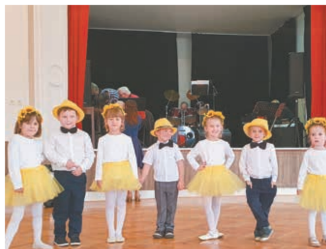
• Dąbrowa. Występ dzieci z polskiego przedszkola w Orłowej-Lutyni.