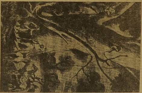
Arah wydziałali go...