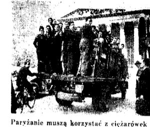
Paryżanie muszą korzystać z ciężarówek w czasie strajku metro i autobusów miejskich.