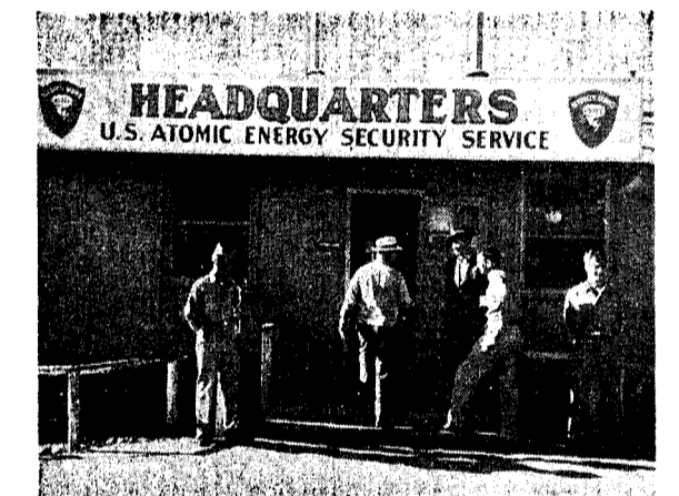
Tak wygląda wejście do głównej kwatery atomowej służby bezpieczeństwa w Las Alamos.

Z tego zdają sobie zresztą sprawę wszystkie polityczne kółka francuskie.