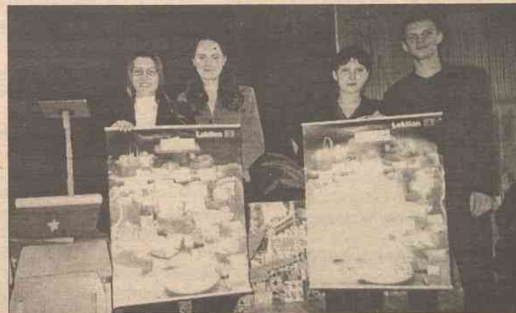
Poszerzono wiedzę w niezwykle istotnym temacie

Na kilka tygodni przed imprezą uczniowie klas starszych szperali w czytelniach, „grasowali” w Internecie, wypytywali znajomych. Codziennie ruszał coraz to nowy temat: prezentacja obecnej sytuacji w krajach anglojęzycznych, przedstawienia osiągnięć krajów niemieckojęzycznych, konkurs wiedzy ogólnej