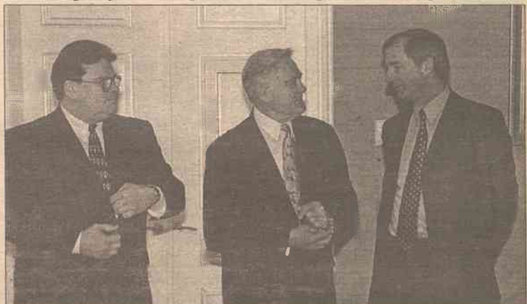
Prócz spotkania z ministrem Linkevičiusem brytyjski minister obrony (od prawej) spotkał się też z prezydentem Valdasem Adamkusem