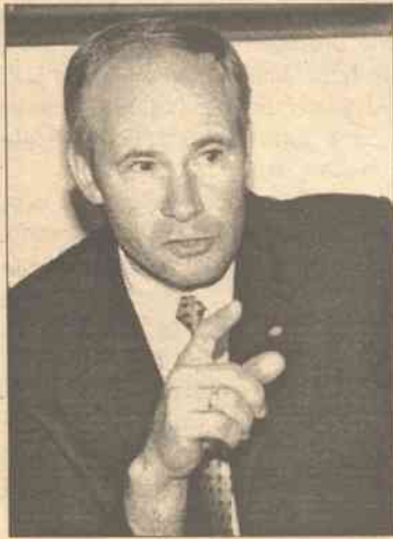
Minister Monkevičius uważa, że „oświadczenie” ma charakter abstrakcyjny

Wszyscy chętni mogli przedstawić swe propozycje, wypełniając przygotowaną przez grupę roboczą ankietę. Otrzymane opinie grupa re-