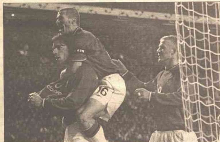
Wiele powodów do radości mieli piłkarze Manchesteru United w meczu z FC Nantes

Od początku spotkania na stadionie w Stambule stroną przeważającą był Liverpool. W 21 minucie