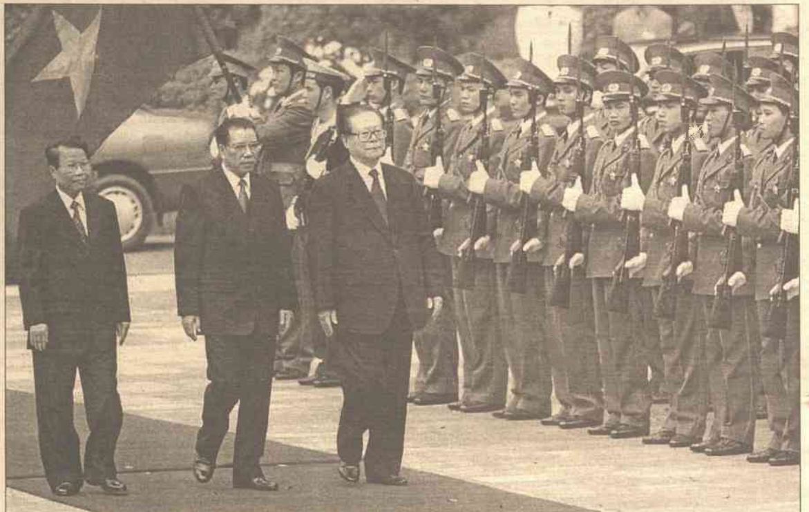
Hanoi powitało chińskiego prezydenta Jiang Zemina (na zdjęciu od prawej) z olbrzymią pompą

Wczoraj Jiang był obecny na ceremonii podpisania dwu dokumentów – porozumienia o współpracy gospodarczej i technicznej oraz o preferencyjnych chińskich kredy-