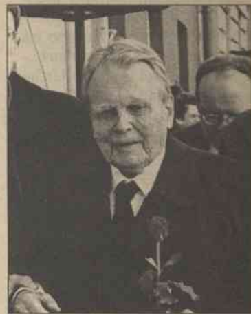
„Jednojęzyczność stawała się obsesją litewskich działaczy” — stwierdził Miłosz

Goście odwiedzą również wileńskie getto, Muzeum Żydowskie w Wilnie, miejsce zagłady Żydów w Ponarach, kowieńskie getto oraz IX Fort. (BNS)