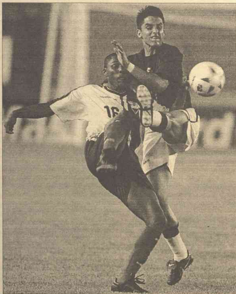
Reprezentacja Kolumbii, gospodarz turnieju, pokonała w Barranquilla Chile 2:0 (1:0) w meczu trzeciej kolejki grupy A turnieju Copa America. Obie drużyny już wcześniej zapewniły sobie miejsce w ćwierćfinale. W drugim spotkaniu tej grupy Ekwador (na zdjęciu w światłych strojach) wygrał z Wenezuelą 4:0 (2:0).

Klasyfikacja generalna po 10. etapach: 1. Francois Simon (Francja/Bonjour), 2. Andriej Kiwiliew (Kazachstan/Cofidis) strata 11.54, 3. Stuart O'Grady (Australia/Credit Agricole) 18.10, 4. Lance Armstrong (USA/US Postal) 20.07, 5. Joseba Beloki (Hiszpania/ONCE) 21.42, 6. Christophe Moreau (Francja/Festina) 22.21, 7. Jan Ullrich (Niemcy/Telekom) 22.41, 8. Igor Gonzalez Galdeano (Hiszpania/ONCE) 23.34, 9. Oscar Sevilla (Hiszpania/Kelme) 24.07, 10. Santiago Botero (Kolumbia/Kelme) 25.52.