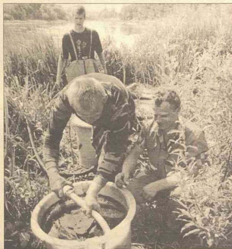
Ogółem zebrano ponad półtorej tony mieszanki wody z olejem