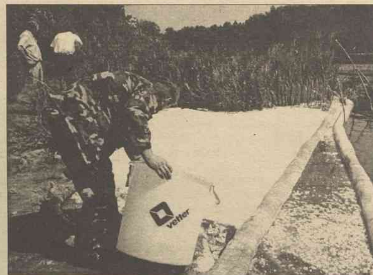
Wyjście rury do Wilii odgradzono od rzeki i posypano proszkiem absorbującym naftę