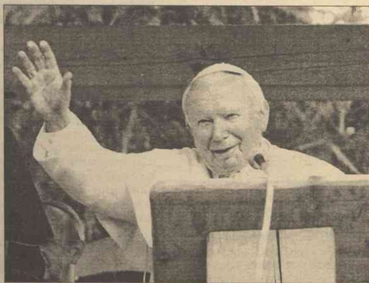
Prezydent USA George W. Bush nazwał papieża Jana Pawła II „wielkim światowym przywódcą” w wywiadzie opublikowanym wczoraj przez włoski dziennik „La Stampa”. Prezydent Bush dodał, że jest „bardzo wzruszony” mającym nastąpić 23 lipca swym pierwszym spotkaniem z papieżem. Prezydent USA oświadczył w wywiadzie dla „Stampty”, że „papieskie działania ma wielkie znaczenie dla wolności człowieka”. „Papież to obrońca życia o niezmiernie sile moralnej, mający wielki autorytet w moim kraju” – powiedział Bush

Prezydent Władimir Putin zapewnił na początku lipca, że nie ma zamiaru uchylać moratorium i przywracać kary śmierci, mimo że ostatnie sondaże pokazują, że pragnęłoby tego 80 proc. społeczeństwa. Wśród zwolenników kary śmierci jest znany pisarz noblista Aleksander Solżenicyn.