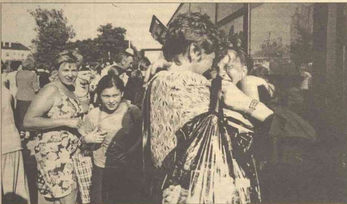
Radość spotkania, bo najlepiej jest u mamy...