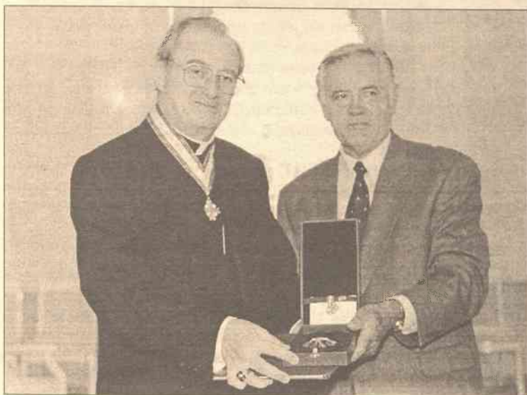
Za pomyslną czteroletnią pracę na Litwie — Order Wielkiego Księcia Litewskiego Giedymina

Prezydent Valdas Adamkus wczoraj Orderem Wielkiego Księcia Litewskiego Giedymina drugiego stopnia udekorował kończącego kadencję nuncjusza apostolskiego na Litwie, Jego Ekscelencję arcybiskupa Ervina Josefa Endera.