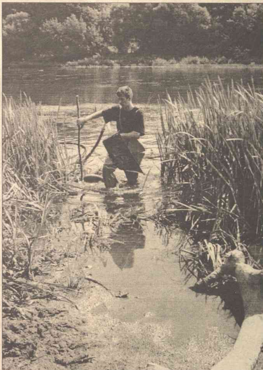
Rosliny zatrzymały część oleju tworząc wzdłuż brzegów Wilii wiele plam, które skrupulatnie usuwają strażacy

inna firma. Prawdopodobnie przedstawiciele firmy „Fegda” nie przyznają się do winy.