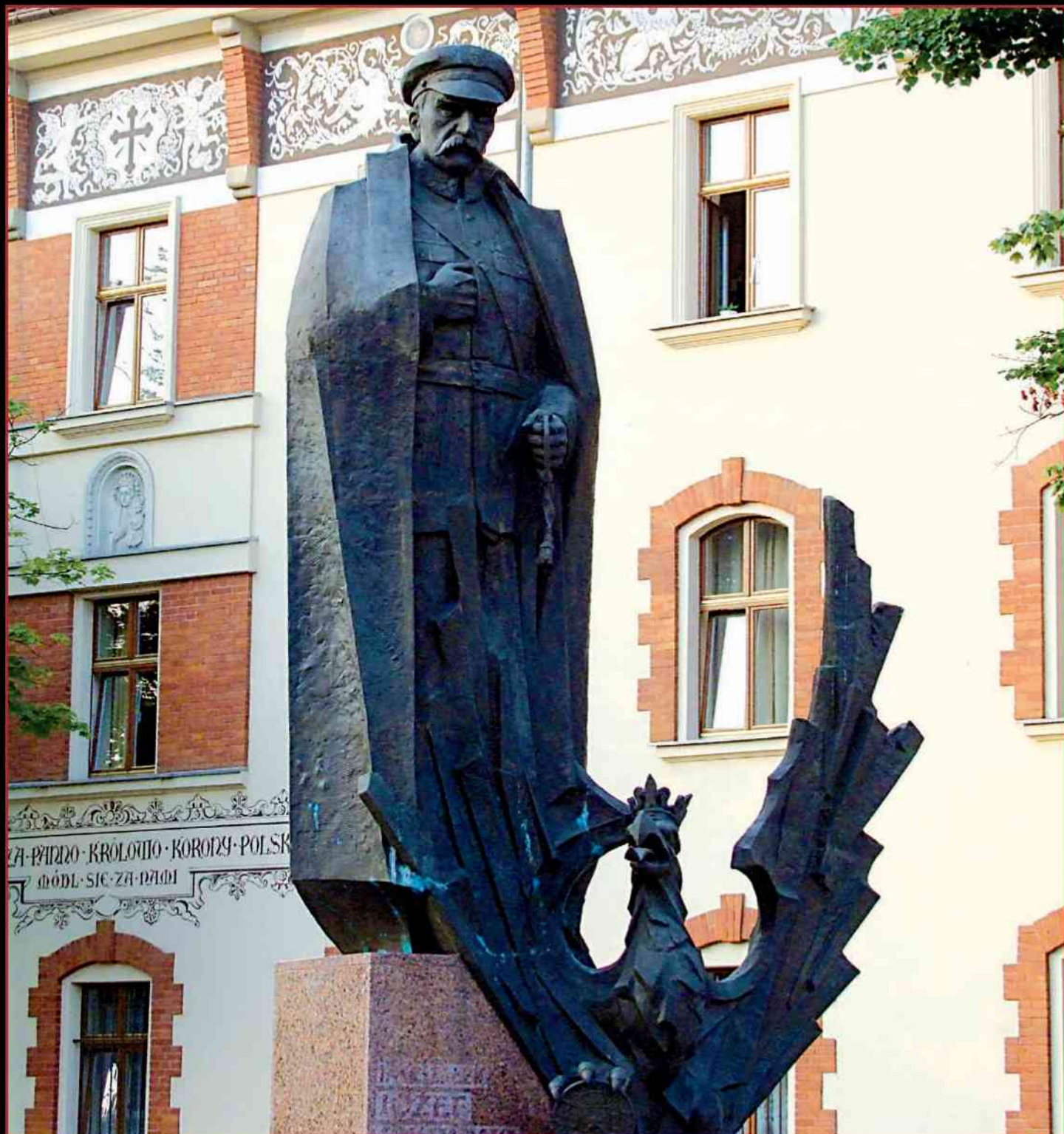
Krakowski pomnik marszałka Józefa Piłsudskiego