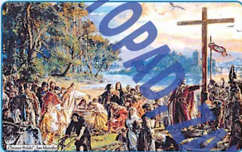
„Chrzest Polski”, Jan Matejko