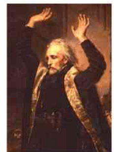
ks. P. Skarga