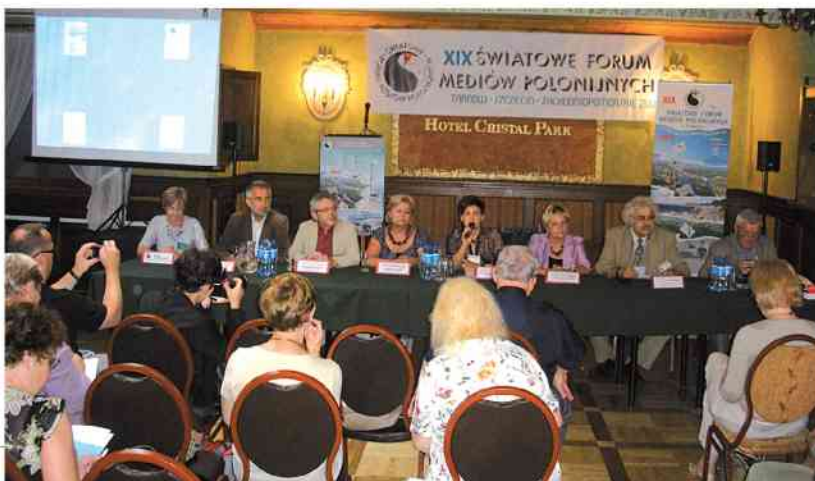
fol. D. Tarnowska-Kasparian

10 września uczestnicy Forum wybrali się do Karlina, Dygowo i Ustronia Morskiego. Karlino robi wiele by zachęcić do osiedlania się i inwestowania właśnie na tym terenie. Posiada specjalne tereny inwestycyjne. Z rolniczego staje się przemysłowym i turystycznym. Dygowo, mała gmina – wiele możliwości, Plac Wolności w Dygowie zdobył, w 2010 r. wyróżnienie specjalne Towarzystwa Urbanistów Polskich za najlepiej zagospodarowaną przestrzeń publiczną. Jest tu Pomnik Łosiosa i Biesiada Łososiowa połączona z ogólnopolskimi zawodami wędkarskimi. Ustronie Morskie to miejsce idealne dla spokojnego wypoczynku. Czysta plaża wyróżniona Błękitną Flagą. Letnia stolica Satyry, Karykatury i Dobrego Humoru.