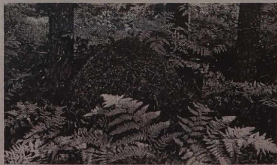
Wiosna - pracowity okres dla działkowiczów i ...dla mrówek również.

Zioła lubią pulchną, żyzną glebę, zasobną w próchnicę, o odczynnie zasadowym lub obojętnym. Nawożenie organiczne i mineralne stosuje się podobnie jak pod warzywa o średnich lub nieco większych wymaganiach nawozowych (stanowisko II roku po oborniku). Raz na trzy lata należy glebę zaprawować (1,5 - 3 kg nawozu wapniowego na 10 m. kw.) Kąć zielski może być usytuowany w jednym miejscu, ale można też poszczególne gatunki rozmieścić na terenie całej działki, w zależności od