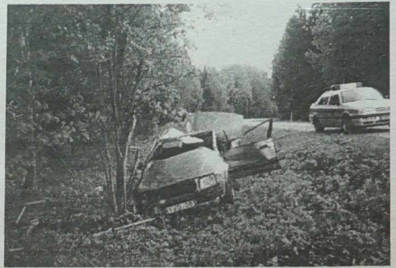
NA ZDJĘCIU: ... wielu mieszkańców rejonu obawia się niebezpieczeństwa na drodze.