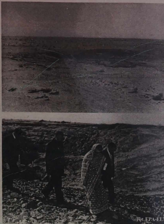
To zdjęcie zostało zrobione 19 maja 1974 roku podczas zwiedzania poligону atomowego przez Indirę Gandhi przed pierwszą próbą atomową.

Administracja Clintonowa popiera również inwestycje amerykańskie w szybko rozwijających się ekonomicznie Indiach. Los ich stanie pod znakiem zapytania, jeśli zastosowane zostaną sankcje i wzrośnie napięcie