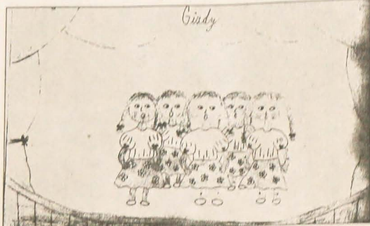
Rys. Kasia Cmiel, PSP Bukowiec, kl. 5 (z lewej). Monika Broda PSP Karwina-Nowe Miasto, kl. 4 (po prawej).