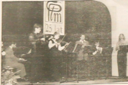
«Słoneczny sektek» podczas występu w Stonawie...