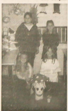
Trzymam was, dziewczynko, za stów i czekam na dalsze listy. Mam nadzieję, że dzieci i ich pani z Ropicy napiszą coś więcej o domku pod dębami, który postarzał się na ich rysunkach...