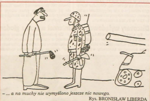
... a na muchy nie wymyślono jeszcze nic nowego.