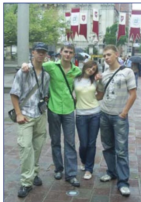
Nачало. Продолжение на стр. 4.