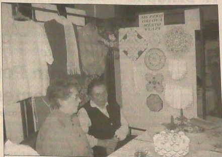
▲ MK PZKO Orłowa-Miasto wystawia hafsy i robótki ręczne, a także wyroby cukierkowe.

Imprezą towarzyszącą wystawie był trzeci turniej amatorów rozwiązywania krzyżówek i innych rozrywek umysłowych, który zorganizował miejski klub szaradzystów „Permonicy”. W turnieju wzięło udział 10 czterosemiorobowych drużyn - w tym trzy z karwińskiego polskiego gimnazjum oraz jedna z liceum w Rydlutach. Wystawa czynna jest jeszcze dziś do godz. 18.