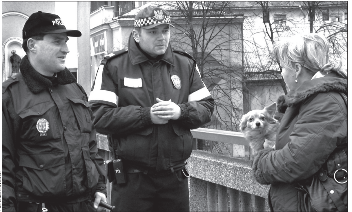
Kiedy wybieramy się z psem do drugiej części miasta, musi posiadać on paszport, znaczek na obroży i być na smyczy.