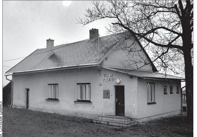
W obecnym Domu PZKO w Kocobędzu mieszkał kiedyś woźny.