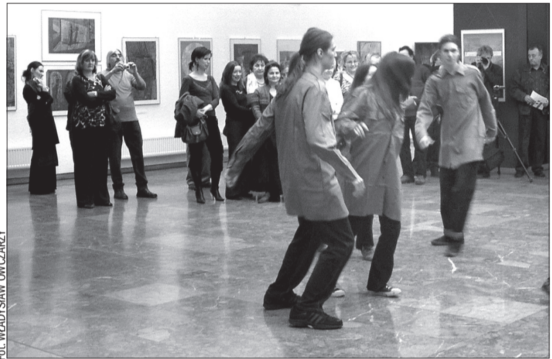
Na wernisażu, w specjalnym układzie tańca nowoczesnego, wystąpili młodzi tancerze z Salgótarján.

Oba mikroregiony oraz gmina Jaworze od kilku już lat organizują m.in. wspólne imprezy kulturalne i sportowe, współpracują też ze sobą szkoły oraz kluby emerytów.